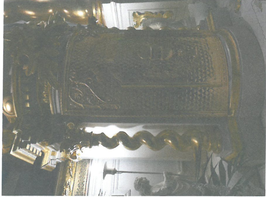
Fot. 3 Ołtarz główny, tabernakulum.

Po obydwu stronach ołtarza znajdują się pełnopostaciowe rzeźby posadowione na autonomicznych podstawach opatrzonych inskrypcją informującą o fundatorach. Rzeźby przedstawiają św. Piotra i Pawła.