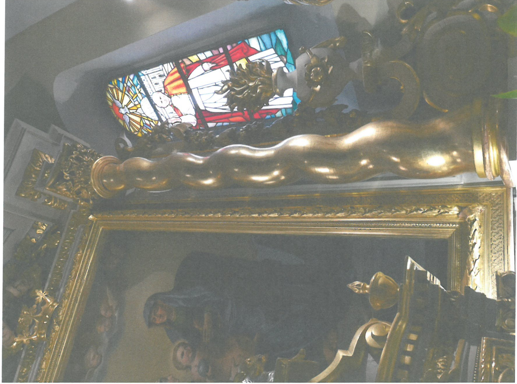
fot. 10 Kościół pw. Św. Anny, ołtarz główny zbliżenie, stan przed konserwacją