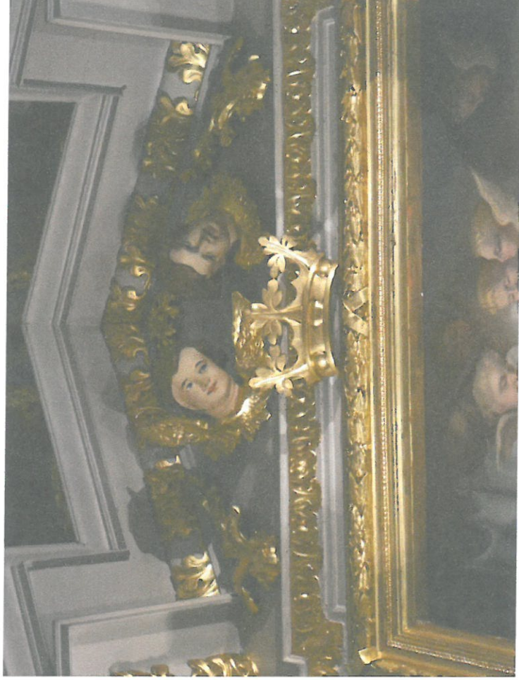
Fot. 2 Ołtarz główny, zbliżenie ukazujące zwieńczenie ramy.

Drewniany ołtarz główny w kościele ma formę architektoniczną przyścienną, z dwiema kolumnami spiralnymi. Mensa jest prostokątna z wolutami po bokach. Nastawa również jest prostokątna z dekoracyjną ramą wokół obrazu i kompozytowymi spiralnie kręconymi kolumnami. Po bokach spływy w postaci girland zakończonych wolutami.