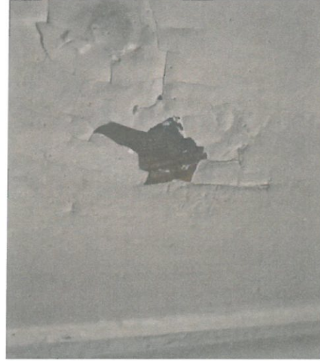
Fot. 6 Ołtarz główny, zbliżenie ukazujące złuszczony fragment wtórnej powłoki.

Ogólnie gruba warstwa wtórnej farby w wielu miejscach uległa spękaniu i złuszczeniu aż do powierzchni struktury drewna.