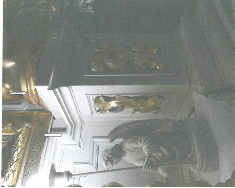
Fot. 87 Ołtarz główny, zbliżenie ukazujące przetarcia złocień na bazach kolumn i ramie obrazu.