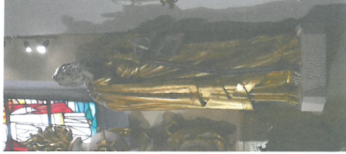
Fot. 40łtarz główny, rzeźby Św. Piotra i Pawła

Struktura ołtarza została wykonana z drewna liściastego i iglastego, polichromowana, złożona i srebrzona w partiach obramień, ram i gzymsów oraz snycerki.