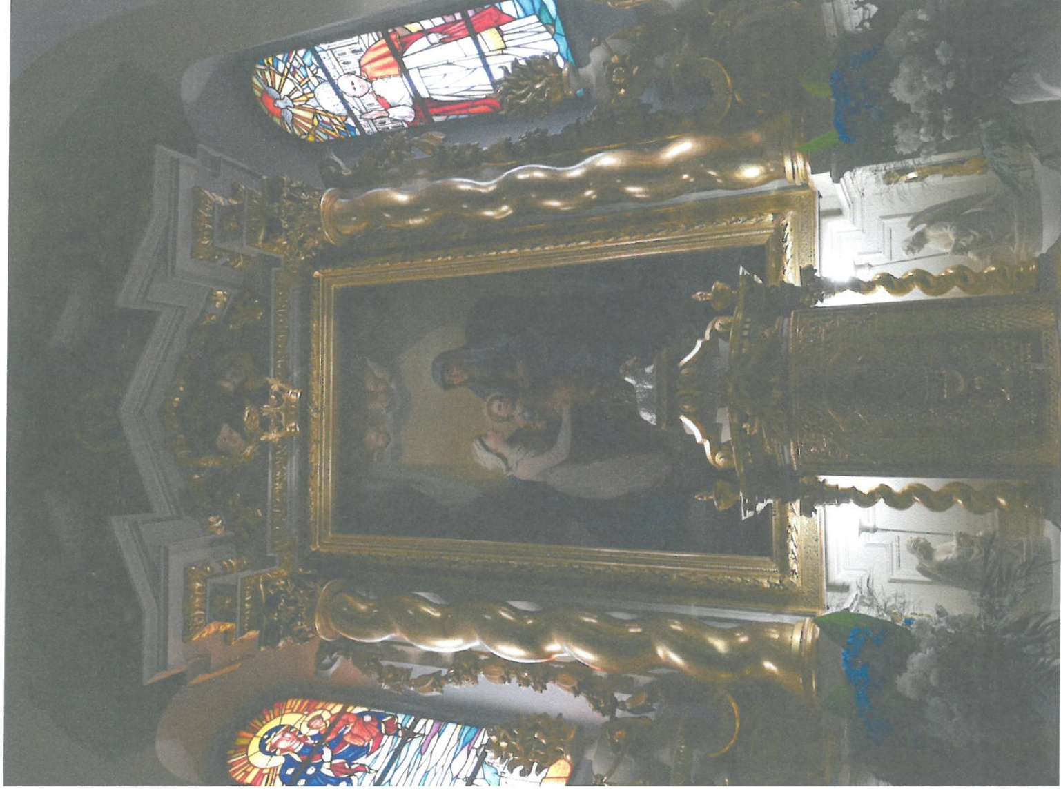
fol. 9 Kościół pw. Św. Anny, ołtarz główny widok ogólny, stan przed konserwacją.