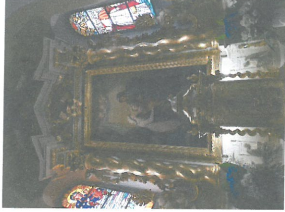
Fot. 1 Ołtarz główny, widok ogólny.

INWESTOR- Proboszcz Parafii pw. Św. Anny ks. Henryk Szustek, Tuczna 18, 21-523