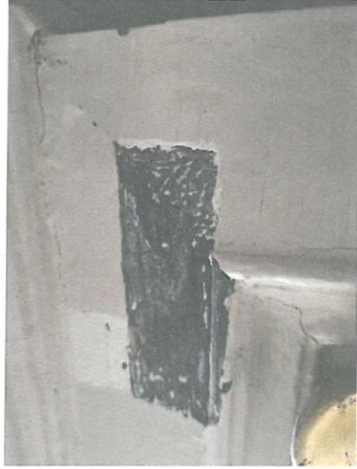
Fot. 5 Ołtarz główny, zbliżenie ukazujące odsłonięty fragment pierwotnej polichromii.

Ogólnie gruba warstwa wtórnej farby w wielu miejscach uległa spękaniu i złuszczeniu aż do powierzchni struktury drewna.