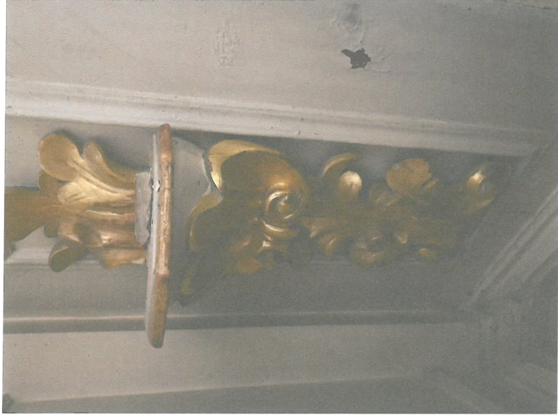
Fot. 11 Kościół pw. Św. Anny, ołtarz główny, zbliżenie dolnej części struktury, dekoracja snycerska, stan przed konserwacją